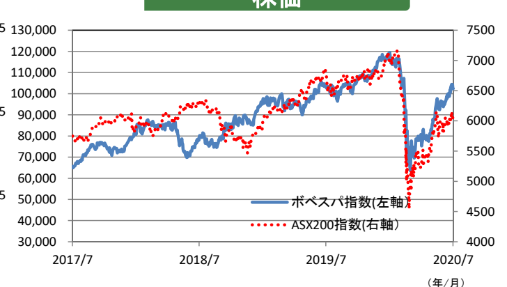
グラフ期間: 2017年7月24日～2020年7月24日、政策金利は2020年7月24日現在